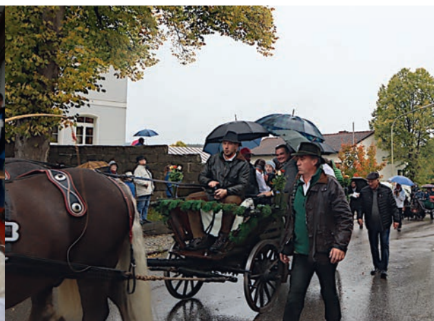
Leonhardiritt nach Parleithen