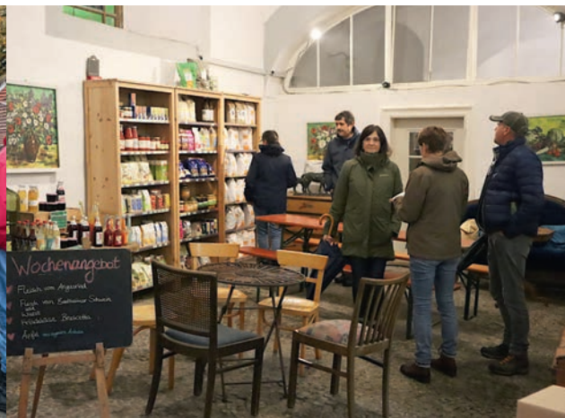
„Schlossgut Hauzendorf“, Detlef Kreuzer